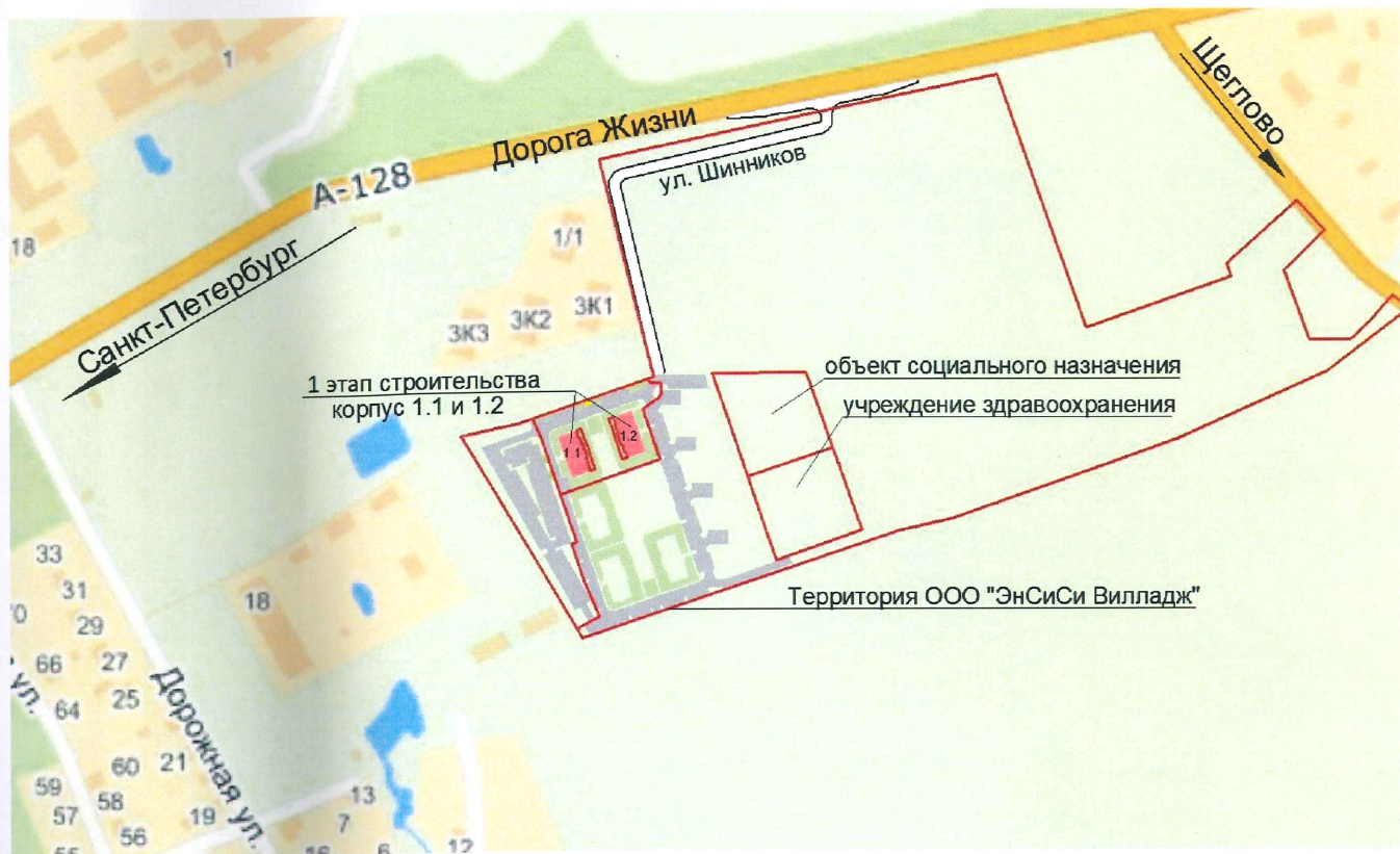
СХЕМА РАЗМЕЩЕНИЯ ОБЪЕКТА

Приложение №2 к Изменению № 2 от 30.07. 2013 с изменениями №1 от 11.06.2013 года, опубликованными на сайте ncsr.ru в Проектную декларацию от 28.05.2013 года опубликованную в газете «Невское время» О проекте строительства Жилого комплекса со встроенными помещениями (1 этап строительства, корпус 1.1 и 1.2) по адресу: Ленинградская область, Всеволожский район, ЗАО «Щеглово», уч.12, кадастровый номер земельного участка 47:07:0957004:235